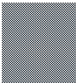
50% NOIR (TRAME 30)